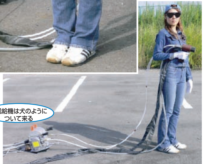
線送給機は犬のように ついて来る