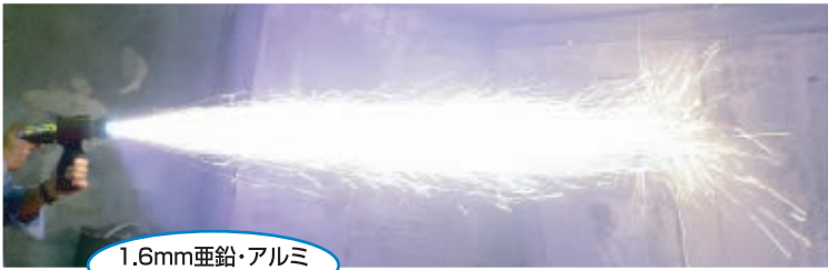
1.6mm亜鉛・アルミ 擬合金溶射