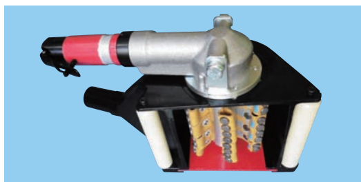
▲ エアモーターが羽根車を回転して超硬ビットでショットのように叩く